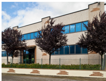
Sede di Montepulciano

Costituitasi nel 2002 da un nucleo di professionisti operanti nella provincia di Siena, Pitagora ha subito un'evoluzione rapida e costante negli anni, tanto da avere oggi ben tre sedi: la sede legale e operativa, a Montepulciano, e le sedi operative di Colle di Val D'Elsa (dal 2007), e Sesto Fiorentino (dal 2018).