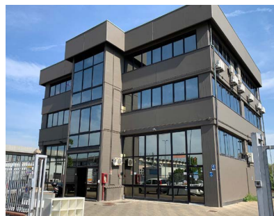
Sede di Sesto Fiorentino