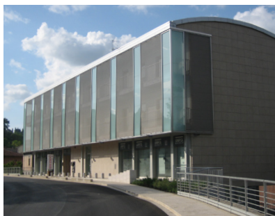
Sede di Colle di Val d'Elsa