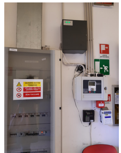
Figura 5 Quadro Elettrico Mensa