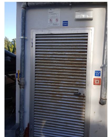
Figura 2 Centrale Termica Lotto 2: terrazza