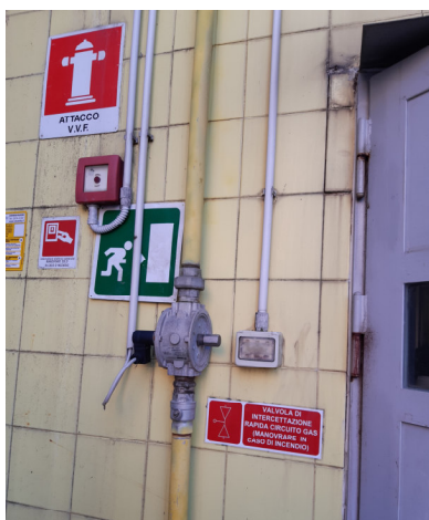
Figura 3 VALVOLA GAS MENSA: esterno ingresso dipendenti