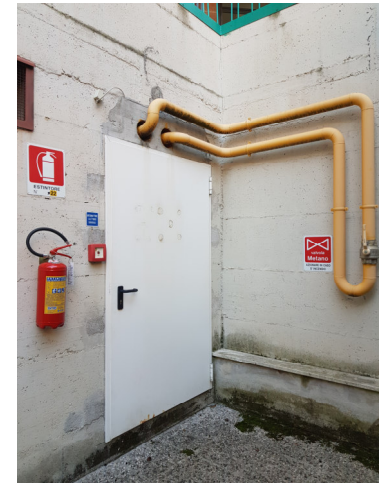
Figura 1 Centrale Termica Lotto 1: scale esterne