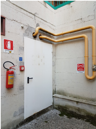
Centrale Termica Lotto 1: scale esterne

1) Se non è presente alcun focolaio ( FALSO ALLARME ) l'ADDETTO ALLA SQUADRA EMERGENZA: