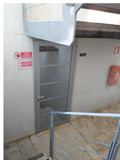
Figura 3 Localizzazione Centrale Termica