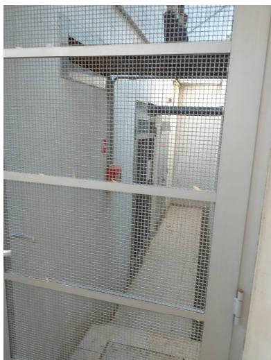
Figura 4 Esterno Centrale Termica con sgancio