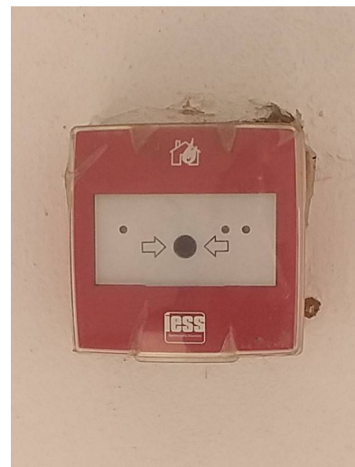
Figura 2 Pulsante allarme

L'ADDETTO ALLA SQUADRA EMERGENZA contatta telefonicamente gli alloggiati nella camera e chiede di verificare la motivazione dell'attivazione dell'allarme.