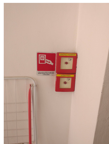
Figura 5 Pulsante sgancio impianto elettrico